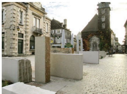
Place Beffroi - Nuits-saint-Georges - France