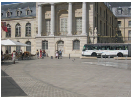
Place de la Libération - Dijon - France