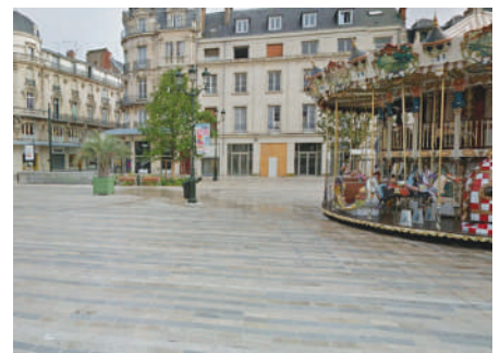
Place Martroi - Orléans - France